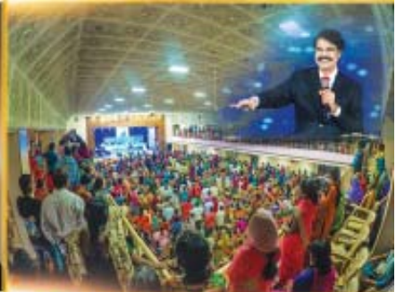
KAKINADA SEP 13