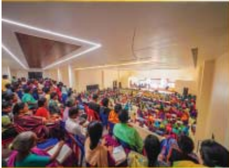
UPPADA SEP 12