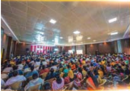
BENGALURU AUG 15

Revive Us Again, O God! I Know You Will! Give Us A Fresh Start! Psalms 85:6