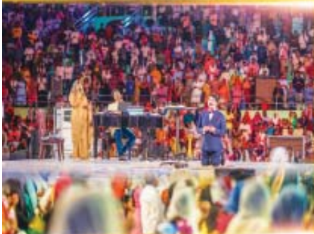
HYDERABAD SEP 17