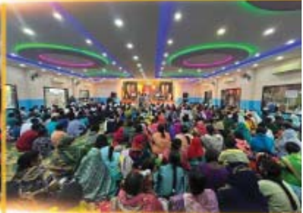
RAJAMUNDRY AUG 16