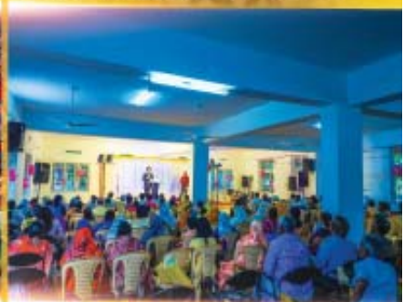
COIMBATORE SEP 19

ప్రభుడు ఒక్కమితే త్వరలో అవేగ స్పందనలలో మిమ్మా గానో టుగెదర్లు ఏర్పాటు చేయాలనుకుంటున్నాము. మీరును ప్రార్థించండి! దొడ్లారండి!